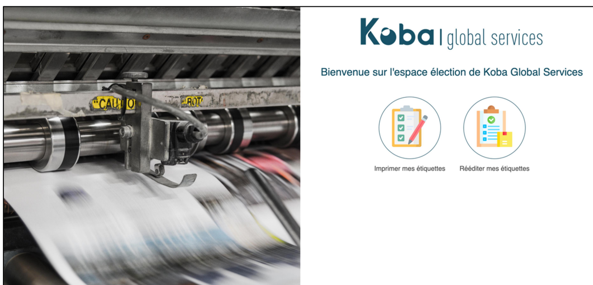
Exemple de principe de la plateforme IMPRIMEUR